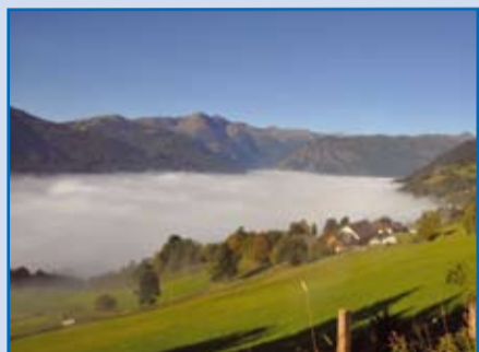
„Herbststimmung in St. Michael“