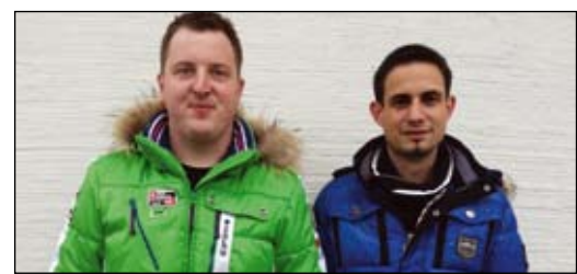
K&S Kremser und Sampl Gmbr Mobil: 0664/2246837 Mail: office@ks-werbetechnik.at