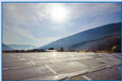
PV Anlage am Umweltzentrum Bild des Monats von Roland Holitzky.