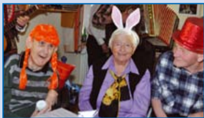
„Fasching im Pensionistenwohnheim“