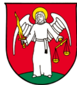
Foto des Monats

Ein Service der Marktgemeinde, des Tourismusverbandes sowie des Vereins Wirtschaft St. Michael