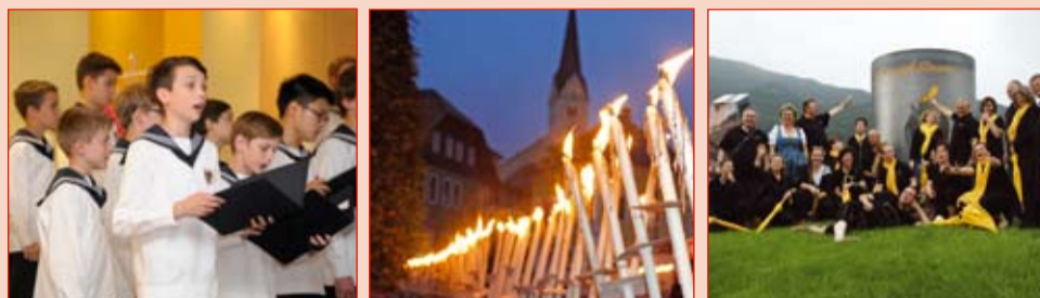
Die 10. Auflage des Internationalen Chorfestivals „Feuer und Stimme“ wurde zu einem großartigen Erfolg!

Sehen Sie auf Seite 3 zahlreiche Highlights von diesem kulturellen Großereignis.