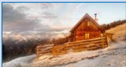
„Speiereck Halterhütte - erster Schneefall“ bei Schönwetter bis Ende Oktober von Fr-So geöffnet Bild des Monats von Frau Barbara Schyr